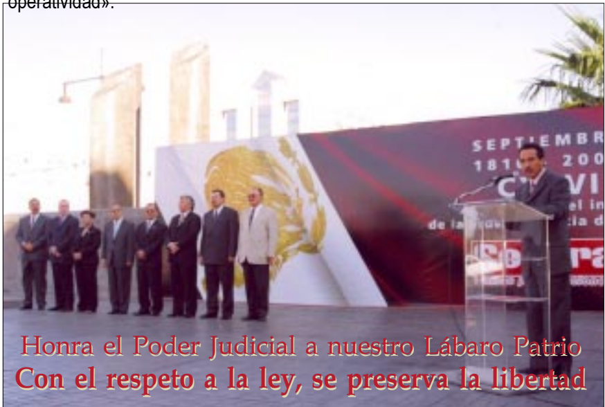
Honra el Poder Judicial a nuestro Lábaro Patrio Con el respeto a la ley, se preserva la libertad

El también presidente del Tribunal Superior de Justicia del Distrito Federal advirtió que mientras no se logre cristalizar la más sana exigencia de alcanzar la autonomía financiera de los tribunales locales, «la más modesta de las leyes, pero también la más innovadora, irremediablemente naufragará por falta de operatividad».