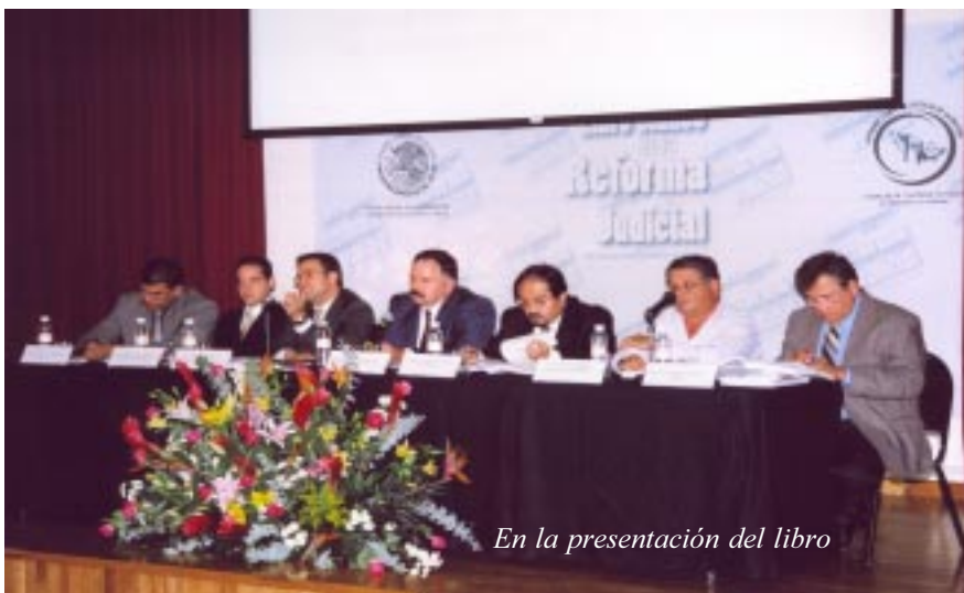
En la presentación del libro

congruencia al conjunto del sistema» Fortalecer a los poderes judiciales, «pues ellos son los responsables de dar respuesta a la mayor parte de la demanda de justicia del país»