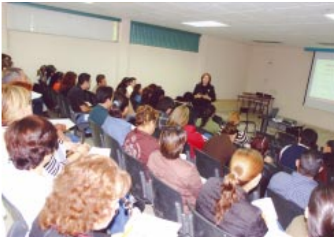
El curso Desarrollo Humano se realizó el 9 de diciembre en Navojoa por personal del Centro de Gobierno del Estado.