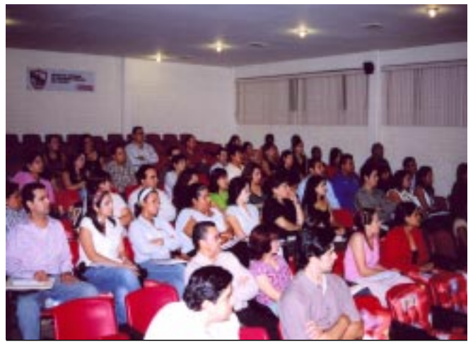
El 18 de agosto inició la Especialidad en Menores Infractores en el Instituto Superior de Seguridad Pública con una duración de 54 fines de semana.